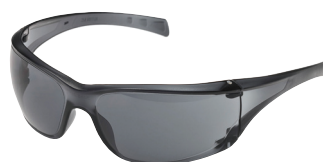
71512-00001M 3M™ Virtua™ AP (graue Scheibe)