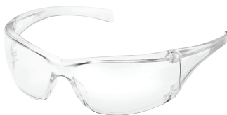
71512-00000M 3M™ Virtua™ AP (klare Scheibe)