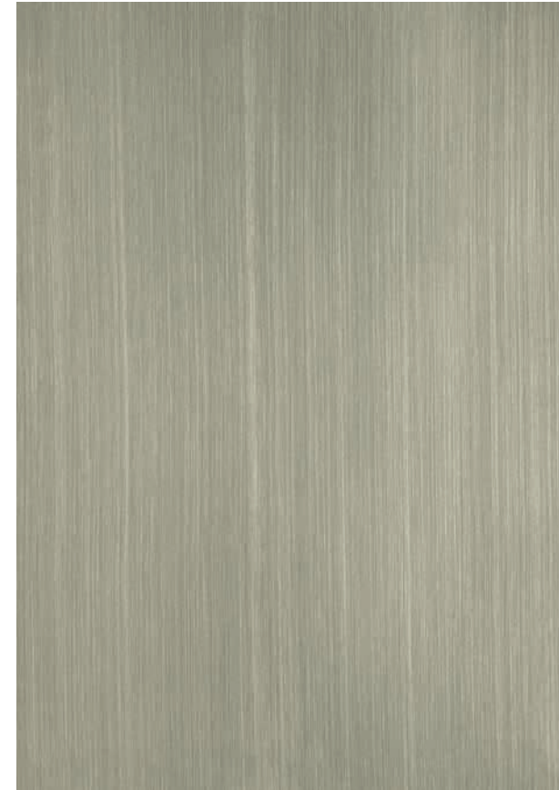
NO 76 Glam Rock senkrecht abgezogen