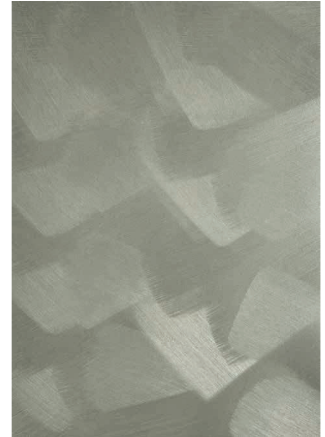
NO 76 Glam Rock im Kreuzgang gebürstet