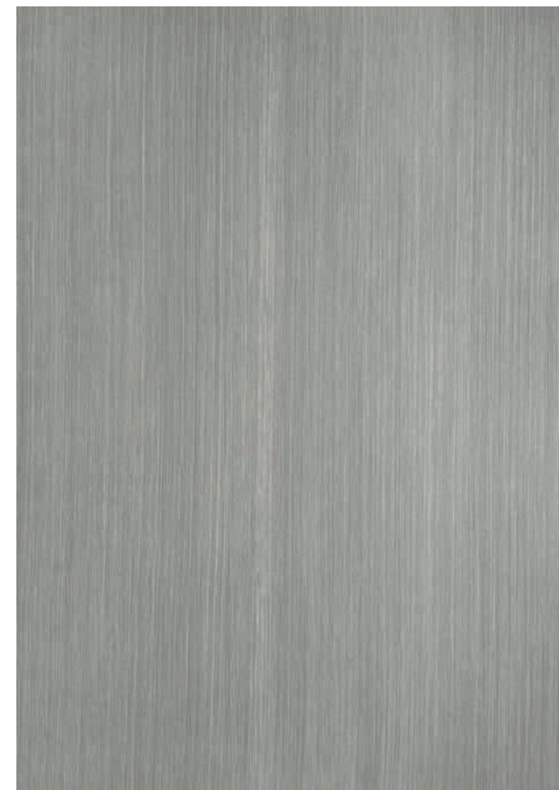
NO 12 Silverizing senkrecht abgezogen