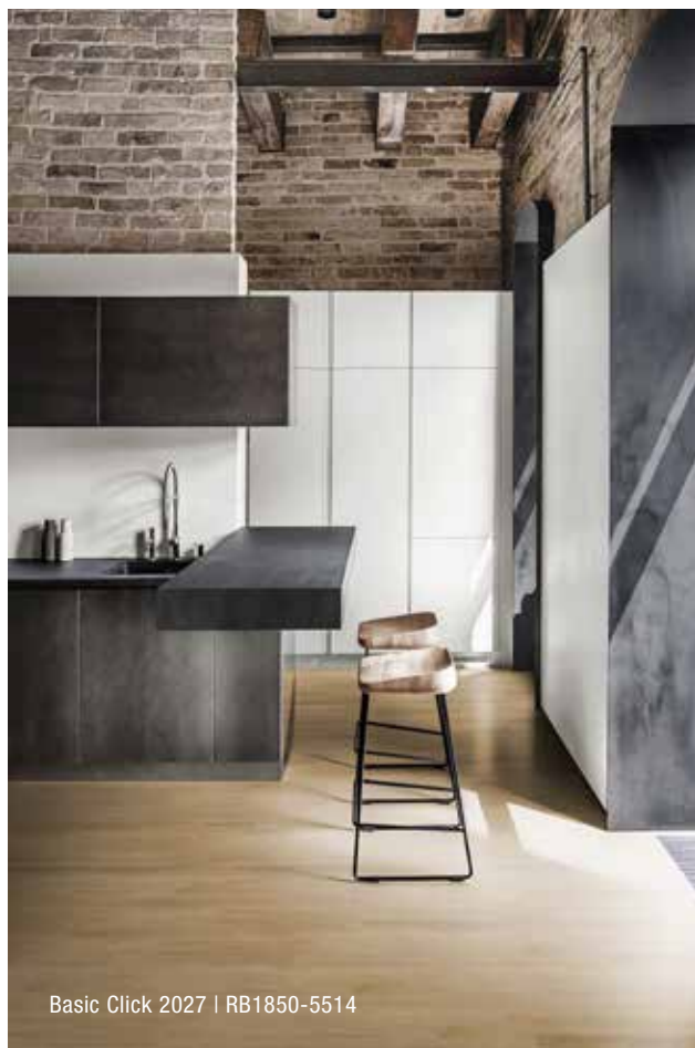
Basic Click 2027 | RB1850-5514