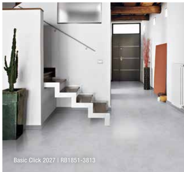
Basic Click 2027 | RB1851-3813