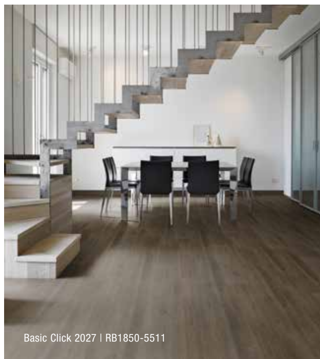
Basic Click 2027 | RB1850-5511