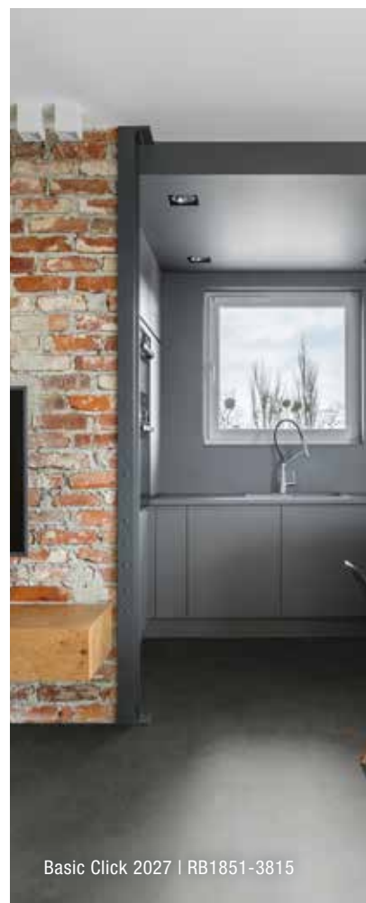
Basic Click 2027 | RB1851-3815

*geeignet für alle herkömmlichen Warmwasser-Fußbodenheizungen bis zu einer Oberflächentemperatur von 27 °C