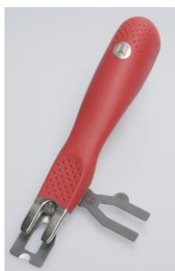
Zum Abstoßen der Schweißschnur empfehlen wir das Mozart Abstoßmesser